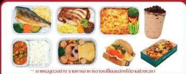
** ภาพเมนูตัวอย่าง รายการอาหารอาจเปลี่ยนแปลงได้ตามช่วงเวลา