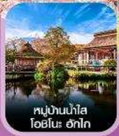
หมู่บ้านน้ำใส โอบิโนะ ฮักไก