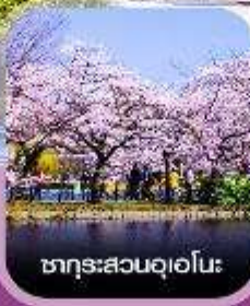
ซากุระสวนอุเอโนะ

คอนเฟิร์มออกเดินทาง ทุกพีเรียด 2 ท่านขึ้นไป