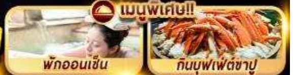
พักออนเซ็น