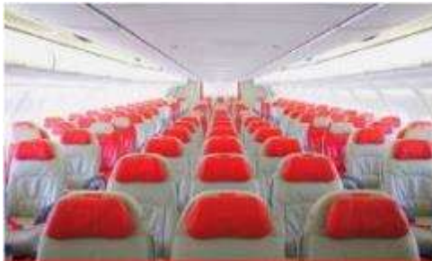
เครื่องลำใหญ่ 377 ที่นั่ง