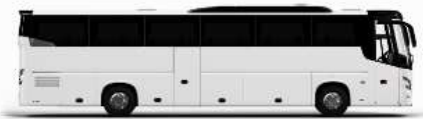
ตัวอย่างรถทัวร์ 1 คัน

ค่าที่พักตามที่ระบุในรายการหรือเทียบเท่าระดับเดียวกัน (พักห้องละ 2 ท่าน) หากประเภทห้องที่ท่านริเวสมาเป็นเตียงเดี่ยว เช่น ริเวสห้องพักเป็น TWIN BED หรือ DOUBLE BED ทางบริษัทขอสงวนสิทธิ์ในการปรับประเภทห้องพัก เป็นตามที่โรงแรมมีอยู่ โดยไม่ต้องแจ้งให้ทราบล่วงหน้า