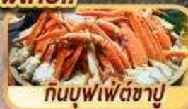
ก้นบุฟเฟ่ต์ซาปู