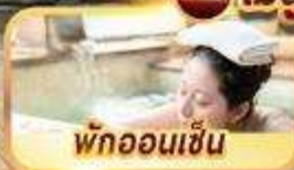
พักออนเซ็น