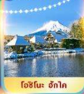
โอะชิโนะ ฮักโค