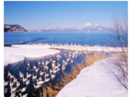
ทะเลสาบอินาวะชิโร Inawashiro-ko