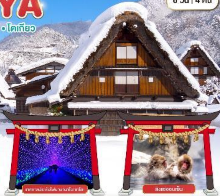
ภาพทางประดับไฟนากาโนะ ซาโตะ