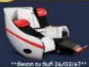
**อัพเดท ณ วันที่ 26/02/67**

Premium Flatbed ที่นั่งพิเศษขนาดกว้าง 19 นิ้ว ที่ความยาวของที่นั่ง 99 นิ้ว สามารถเป็นเบาะได้ทั้งแบบนอนราบ พึ่งพร้อมอุปกรณ์เสริมไว้รองรับท่านอย่างสะดวกสบาย