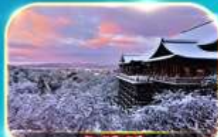
วัดคิโยมิจิ