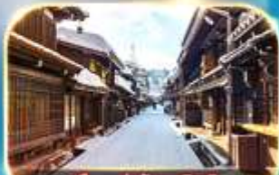
เมืองเก่าชินมาชิซูจิ