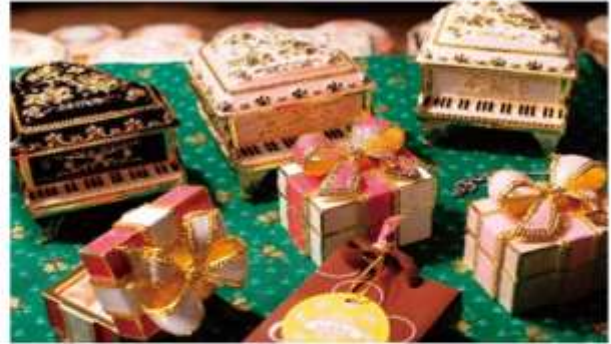
ISHIYA CHOCOLATE FACTORY

เป็นศาลเจ้าของศาสนาพุทธนิกายชินโตประจำเกาะซอกไกโอด สร้างขึ้นในปี 1871 ยุครเริ่มพัฒนาเกาะ ได้ัญญาเชิญเทพมาประทับทั้งหมด 4 องค์ จากศาลเจ้ามีพื้นที่เชื่อมต่อกับสวนมารุยามะ ในฤดูใบไม้ผลิเหมาะแก่การชมดอกซากุระบานในฤดูร้อน วันที่ 14-16 มิถุนายนของทุกปี จะจัดเทศกาล Sapporo Festival หรือ Sapporo Matsuri ซึ่งจะแห่ขบวนไปตามถนน