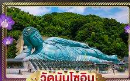
วัดนินโซอิน