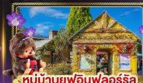
หมู่บ้านยูฟูอินฟลอร์ริล