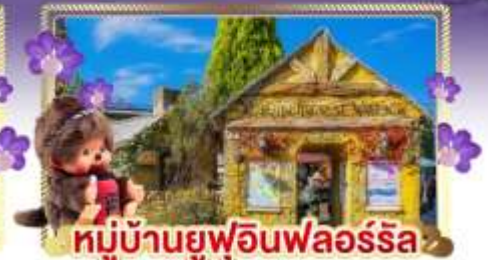
หมู่บ้านยูฟูอินฟลอร์ริล