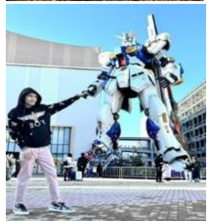
หุ่นกันดั้ม ชื่อ RX93 FF Nu Gundam

เดินทางต่อไปยัง ร้านค้า DUTY FREE ให้ท่านได้ช้อปปิ้งสินค้าปลอดภาษีที่มีคุณภาพ อาทิ เครื่องสำอาง โฟมล้างหน้า(แนะนำ) อาหารเสริม ขนม เครื่องใช้ต่างๆ ฯลฯ ...จากนั้นแวะ แชะรูปกับหุ่นกันดั้มยักษ์ ณ ห้าง LaLaport (หากมีเวลาพอ) มีขนาดใหญ่กว่า Unicorn Gundam ที่โตเกียวและใหญ่กว่า RX93 FF Gundam ที่ Gundam Factory Yokohama เรียกได้ว่าเป็นแลนด์มาร์คสำคัญของเมืองฟูกูโอกะในปัจจุบัน ...จากนั้นอิสระให้ท่านช้อปปิ้งย่าน เทนจิน (Tenjin) หรือ ย่านฮากาตะ (Hakata) เป็นย่านช้อปปิ้งขนาดใหญ่ใจกลางเมือง รวบรวมแหล่งบันเทิง อย่างครบครันไม่ว่าจะเป็นตึกต้นไม้ ร้านค้าที่น่าสนใจ และบรรยากาศสุดคลาสสิก หรือจะเป็นย่านของกินอร่อยๆ อย่างย่านยะไต (Yatai) หมายถึง ชุมชนอาหารที่มีขนาดไม่ใหญ่มาก ที่รวมร้านอาหารแบบฉบับท้องถิ่นเอาไว้มากมาย