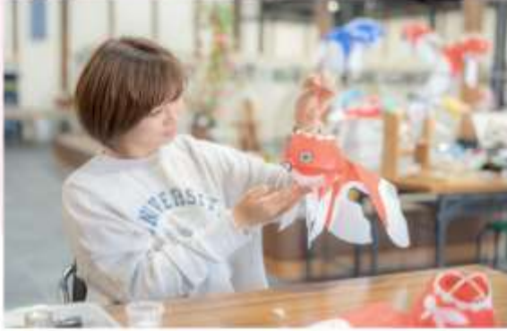
GOLDFISH LANTERN MAKING