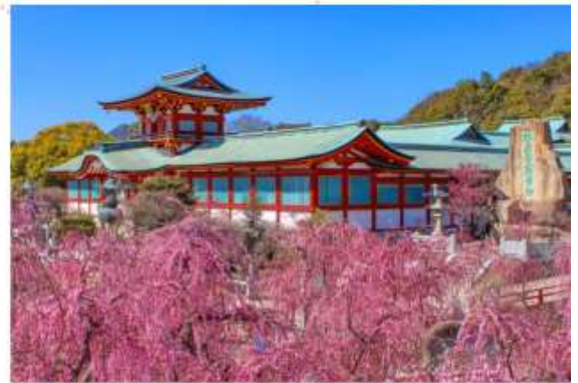
HOFU TENMANGU SHRINE