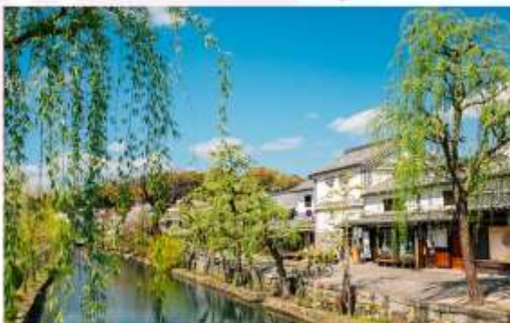
KURASHIKI BIKAN HISTORICAL QUARTER