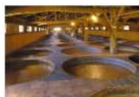
รับประทานอาหารค่ำ ภายในโรงหมัก