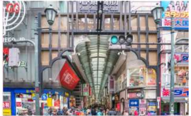
อิสระอาหารกลางวันตามอัธยาศัย (ไม่รวมในรายการ)