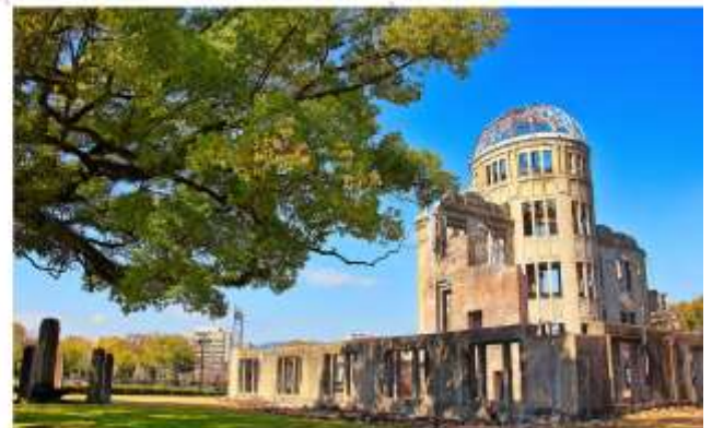
รับประทานอาหารกลางวัน ณ กัดตาคาร