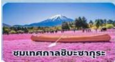
ชมเทศกาลชิบะซากุระ