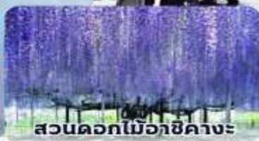
สวนดอกไม้เอจิคาเงะ