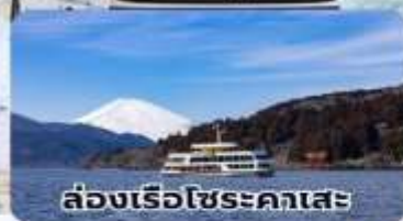
ล่องเรือไซระคาเสะ