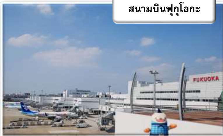
สนามบินฟุกุโอกะ

00.55 น. ออกเดินทางสู่ สนามบินฟุกุโอกะ ประเทศญี่ปุ่น โดยสายการบินไทย เที่ยวบินที่ TG 648