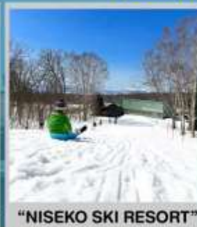
"NISEKO SKI RESORT"