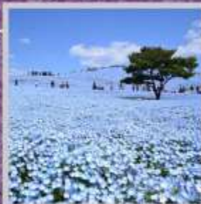
"HITACHI SEASIDE PARK"