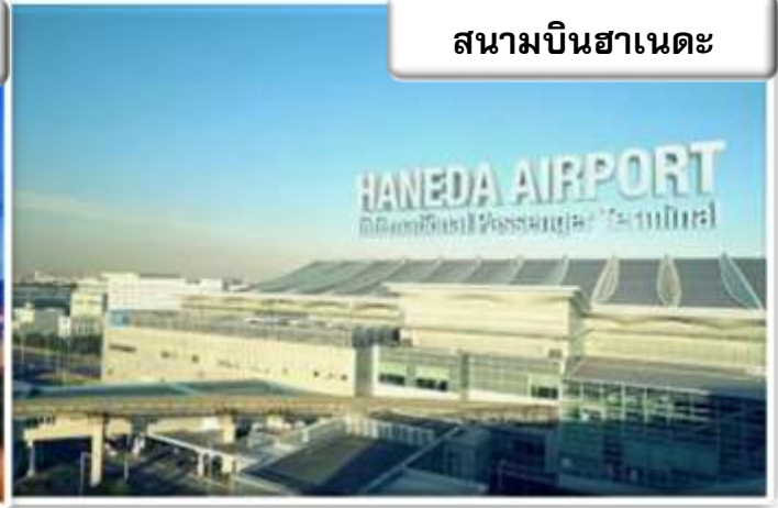
สนามบินฮาเนดะ

เวลา 20.30 น. พร้อมกันที่ ท่าอากาศยานสุวรรณภูมิ อาคารผู้โดยสารขาออกระหว่างประเทศ เคาน์เตอร์ สายการบินไทย เจ้าหน้าที่คอยให้การต้อนรับ ดูแล ด้านเอกสาร เช็คอิน และสัมภาระในการเดินทาง