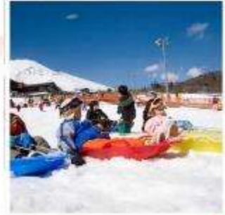
ลานสกีเยติ