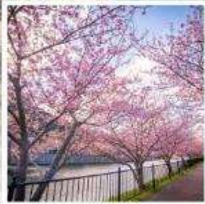
เทศกาลคาวาซุ ซากุระ