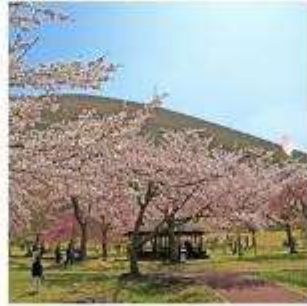
ซากุระ โนะ ซาโตะ