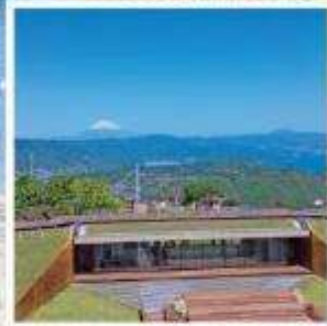
มิโระ คาเฟ่321