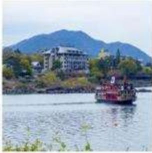
ล่องเรืออปปะระ