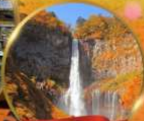
น้ำตกเคกอน