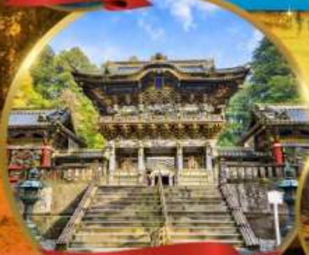
ศาลเจ้านิกโกโทโกโยะ