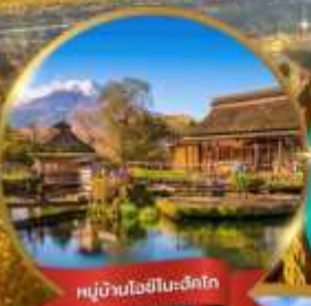
หมู่บ้านโอชิโนะฮักโกะ