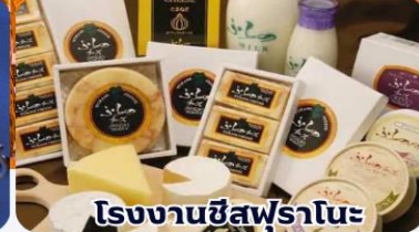
โรงงานชีสฟูรานะ