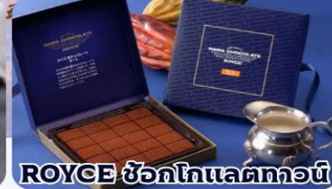
ROYCE ช็อกโกแลตทอว์น