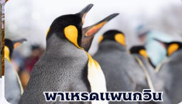
พาเหรดเพนกวิน