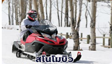
สโนว์โมบิล