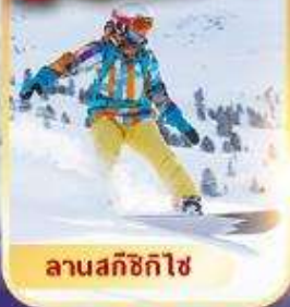
ลานสกีซิกิไซ