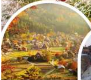
หมู่บ้านฮิราคาซากิ (ฮิโรยาม่า)