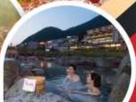
ทะเลร้อนเซ็น

Wifi on bus บริการน้ำดื่ม 10 คน ออกเดินทาง