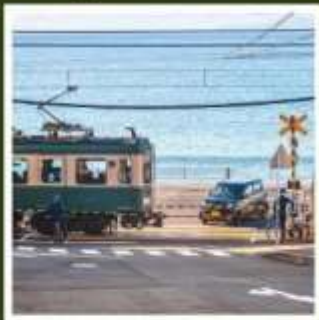
รถไฟเอโบะเด็น