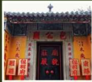
วัดเปากง