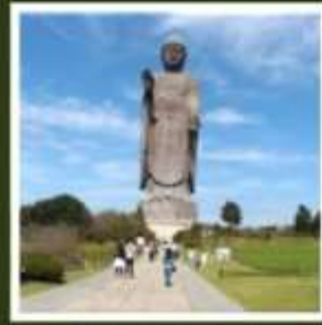
พระพุทธรูปอชิคุโตบุทสึ