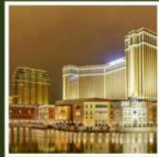
เดอะ เวเนเชียน

ฟูจิยามะ ทาวเวอร์ ขึ้นชมฟูจิจากสวนสนุกที่ไม่เหมือนใคร ชมไร่ชาโอบุจิชะชะบะ อันเลื่องชื่อ