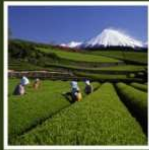
ไร่ชาโอบุจิชะชะบะ