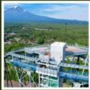
ฟูจิยามะ ทาวเวอร์