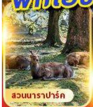
สวนนาราพาร์ค