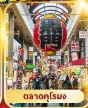
ตลาดคุโรมง