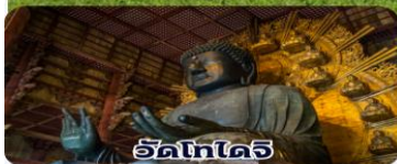
วัดโทไดจิ