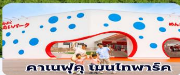
คานะฟุคุ เมินโทพาร์ค