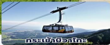
กระเช้าบิวากะโกะ