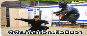
พิพิธภัณฑ์อิกะริวโนจา