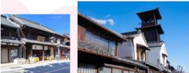
ริบประทานอาหารกลางวัน ณ กิตดาการ

เดินเล่น “ถนนคุระซุคุริ” หนึ่งในไฮไลท์สำคัญของเมืองคาวาโกเอะ ที่ยังคงรักษาสถาปัตยกรรมแบบเอโดะเอาไว้ได้อย่างสมบูรณ์แบบ สิ่งที่น่าสนใจที่สุดของถนนคุระซุคุริคือโกดังไม้ขนาดใหญ่ที่มีผนังปูนสีขาวและหลังคาทรงหน้าจั่ว เรียงรายอยู่สองข้างทาง โกดังเหล่านี้เคยใช้สำหรับเก็บข้าวและสินค้าต่างๆ ในสมัยเอโดะ ปัจจุบันถูกปรับปรุงให้เป็นร้านค้า ร้านอาหาร และพิพิธภัณฑ์