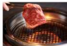
รับประทานอาหารค่ำ ณ กิตตาคาร..พิเศษ!!! อิ่มอร่อยขีดเบิ๊งย่างเนื้อวัวมัดสิซากะ- หอนุ่ม ละมุนลิ้น

ช้อปปิ้งจุใจย่าน "ชินโซบาชิ" สวรรค์ของนักช้อปปิ้งและนักชิม ใจกลางโอซาก้า ถนนคนเดินยาวกว่า 600 เมตร เต็มไปด้วยร้านค้ากว่า 200 ร้าน มีสินค้าหลากหลายประเภท ตั้งแต่เสื้อผ้าแฟชั่น เครื่องสำอางของฝาก ร้าน 100 เยน ให้ท่านเลือกซื้อของฝากติดไม้ติดมือกลับบ้าน..