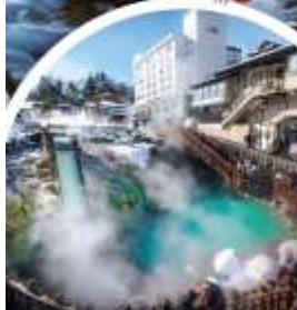
คุซัทสึออนเซ็น