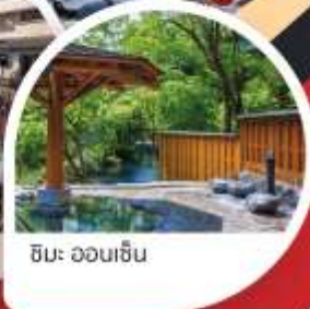
ชิมะ ออนเซ็น