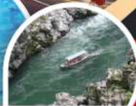
ล่องเรือใบแม่น้ำช่องเขาโอโตะ

นารุโตะ • โคโตะ • โดโกะ • อะฮิเมะ • โอซาก้า