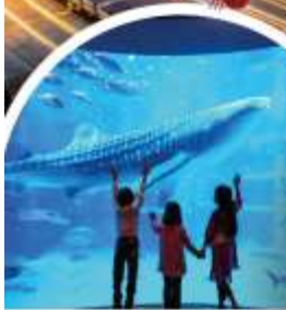
พิพิธภัณฑ์สัตว์น้ำโคยูกัง