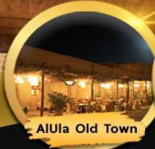
AlUla Old Town