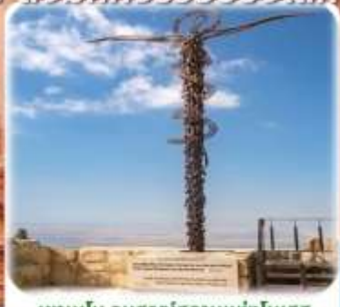
เขานโบ อุนุรณสถานแห่งโมเสส