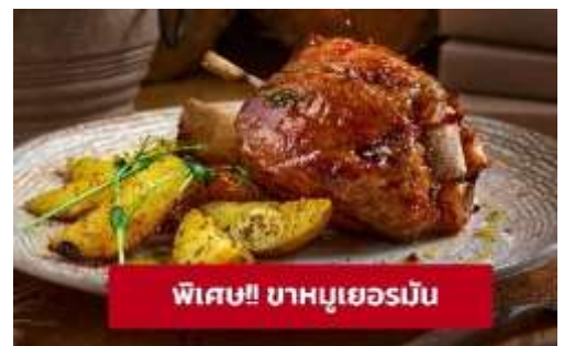
พิเศษ!! ขามูเยอร์มัน

Highlight! เมื่อถึงที่ต้องได้ชิม ขามูเยอร์มัน (German Pork Knuckle) เมนูที่โด่งดังทั่วโลกและเป็นเมนูโปรดของใครหลายๆ คน