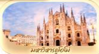
มหาวิหารดูโอโม