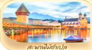
สะพานไมซ์าเปล