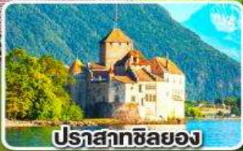
ปราสาทซิลยอง