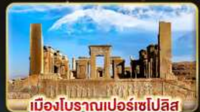
เมืองโบราณเปอร์เซียโปลิส

✈️ บินตรง กรุงเทพฯ - เตหะราน บินภายใน ชีราซ - เตหะราน