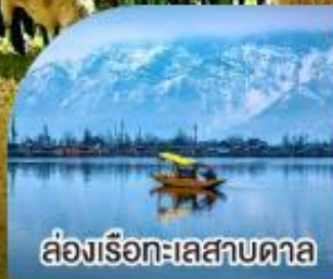
ล่องเรือทะเลสาบคาล