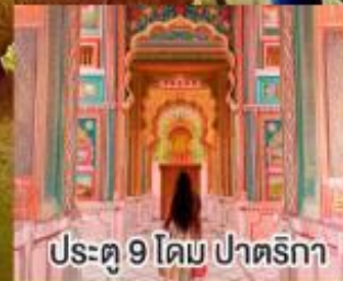
ประตู 9 โดม ปาตริกา