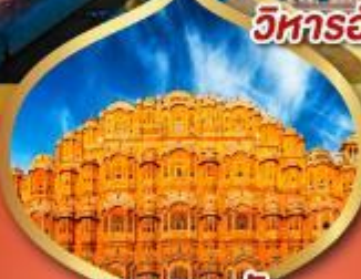
พระราชวัง สายลม