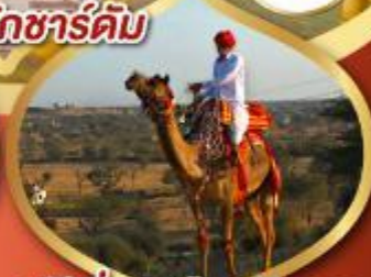
ฟรี ژیู่ซู เมืองมินทวา ราคาเริ่มต้น

05-10 มี.ค.68 12-17, 19-24 มี.ค.68 21-26, 26-31 มี.ค.68 28 มี.ค.-02 เม.ย.68