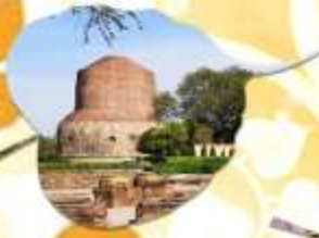
กุสินารา สถานที่ปรินิพพาน