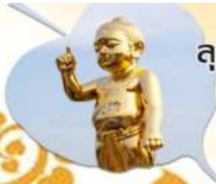
ลุมพินี สถานที่ประสูติ