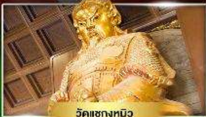
วัดเขangkงหมิว

หมั้นถึงหั้นนำโชควัดแซกง ขี้มั่ว "เจ้ากวณโถม่องอำ"