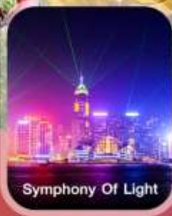
Symphony Of Light

✈️ คอนเฟิร์มออกเดินทาง ทุกพีเรียด 2 ท่านขึ้นไป