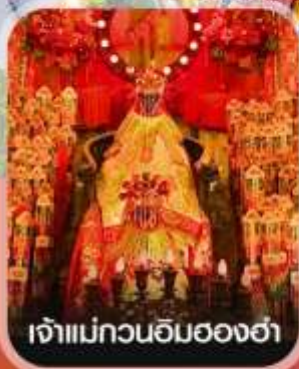
เจ้าแม่กวนอิมของฮำ