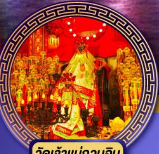
วัดเจ้าแม่กวนอิม ฮองฮ่า