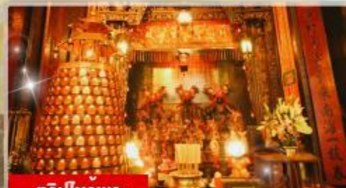
ทริบไหวพระ: