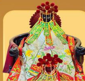
เจ้าแม่กวนอิมสองง่า