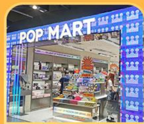
ช้อปปิ้ง POP MART