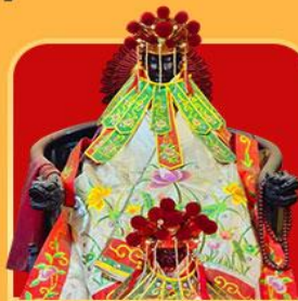
เจ้าแม่กวนอิมสองอำ