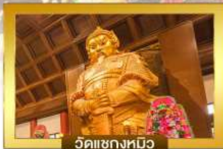
วัดแซงหมิว