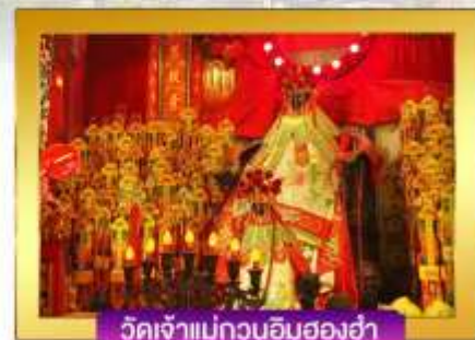
วัดเจ้าแม่กวนอิมสองฮา