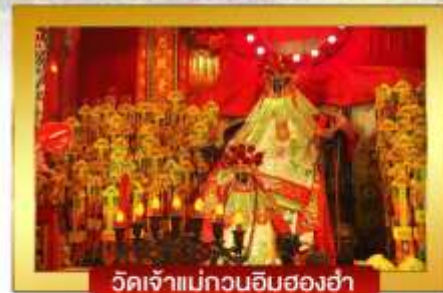
วัดเจ้าแม่กวนอิมฮองฮ่า