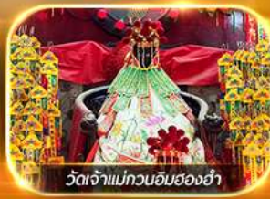
วัดเจ้าแม่กวนอิมฮองฮำ