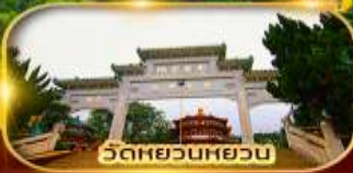
วัดหยวนหยวน