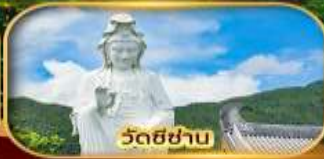
วัดชีซ่าบ