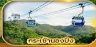
กระเช้าตองปิง